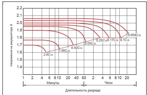
График разрядных характеристик, 25 °С